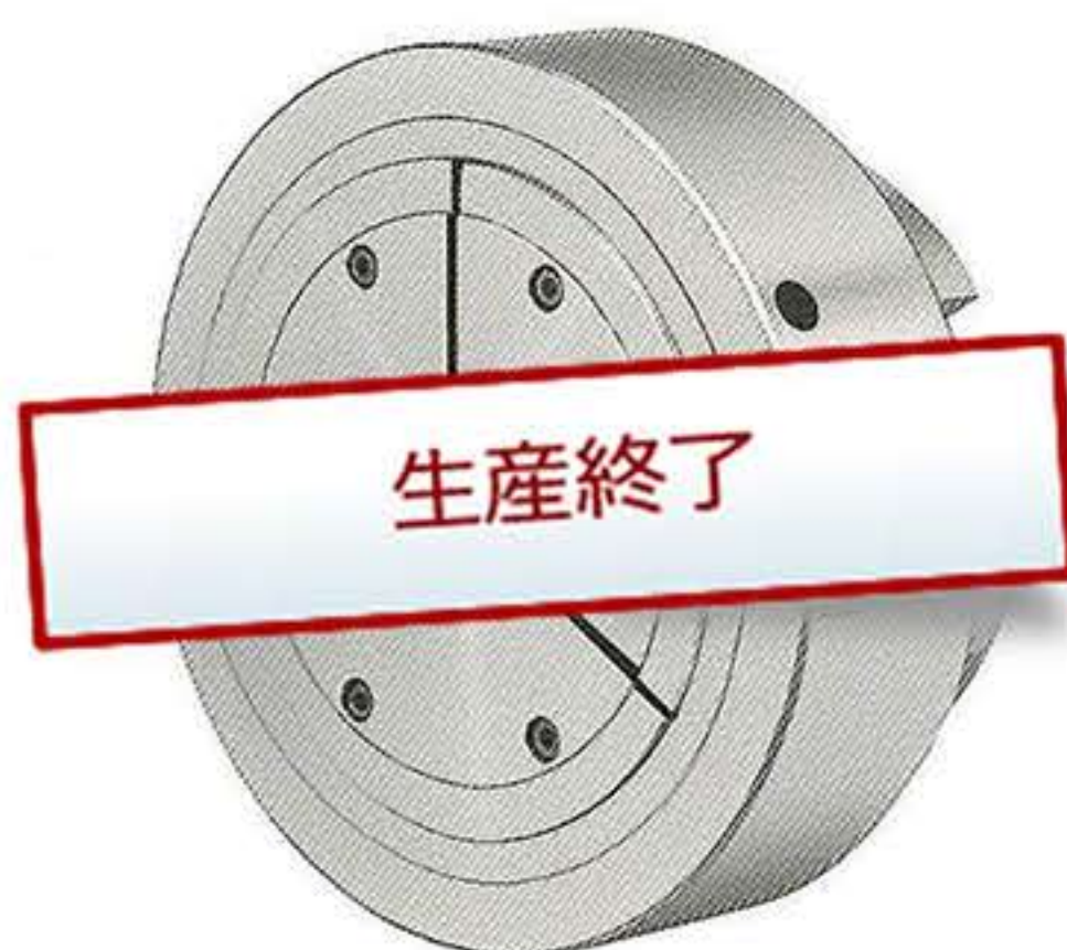
コレットチャック 120φ