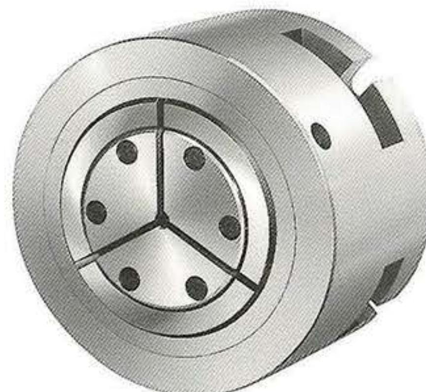
コレットチャック 60φ