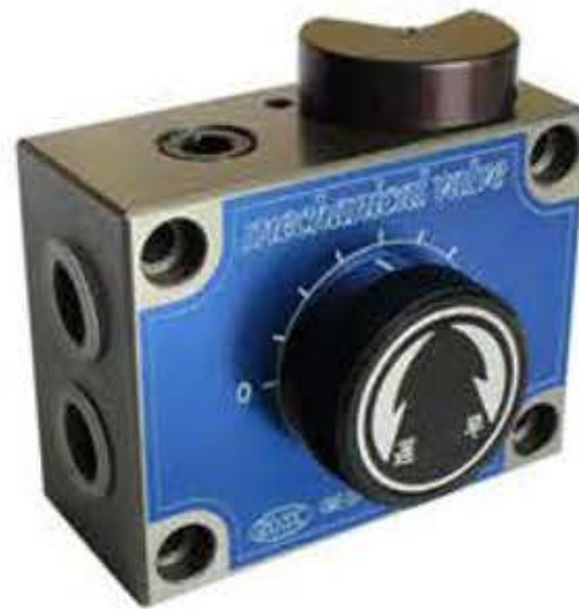
【 M-2型 】