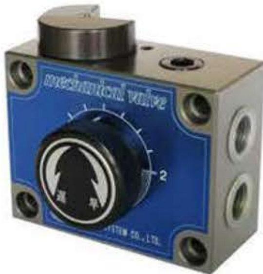
【 M-1型 】

早送り、微動送りの切換はテーブルの精度を維持するため、回転切換方式を採用しています。